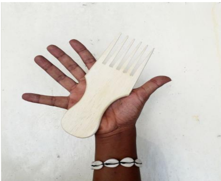
Figura 10. Fotografía de la serie «Aceita?», Moisés Patrício.