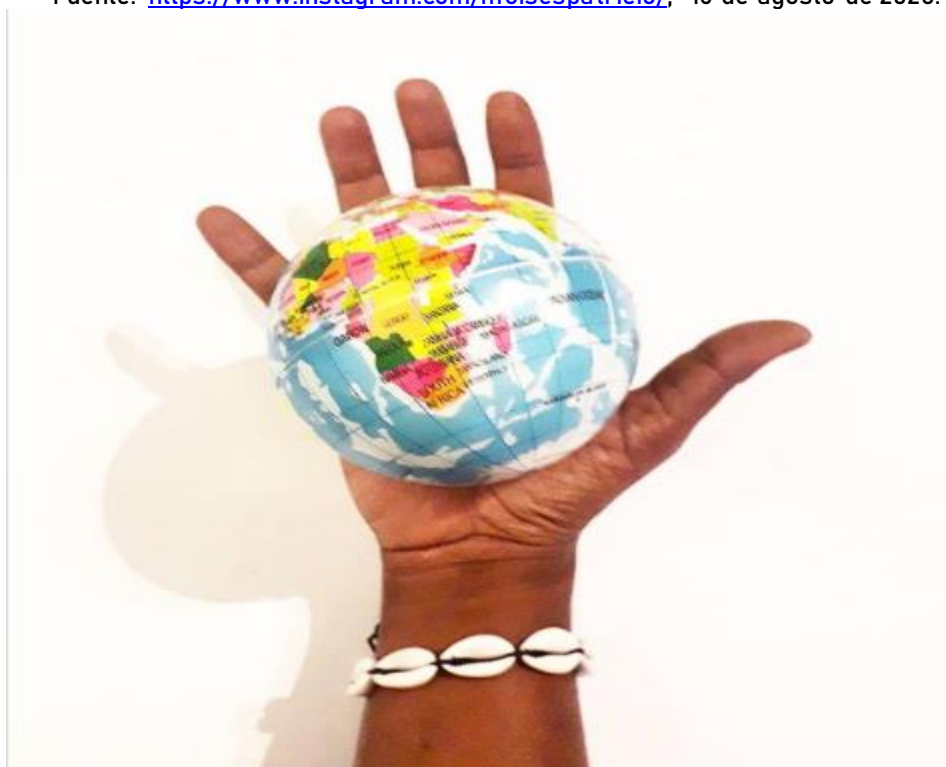
Figura 2. Fotografía de la serie «Aceita?», Moisés Patrício.