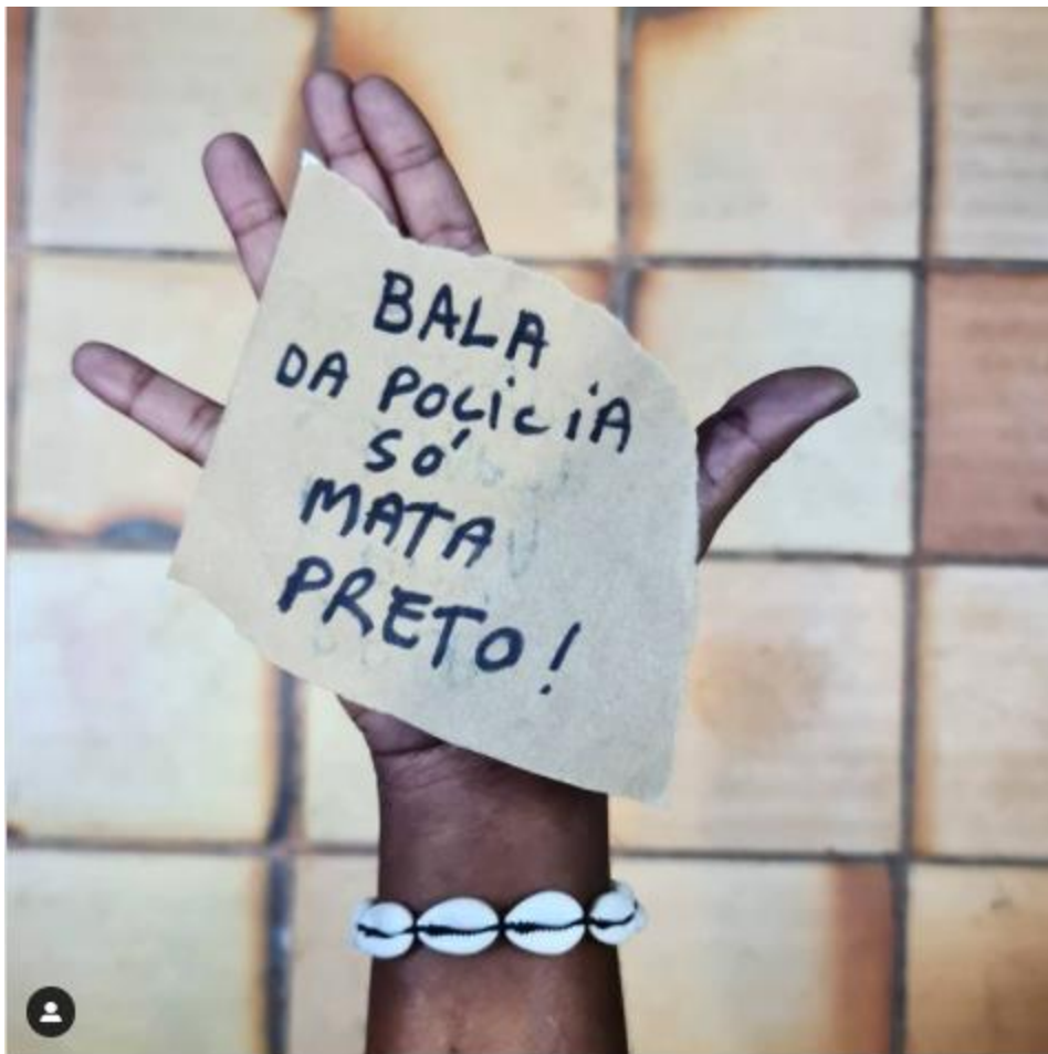
Figura 7. Fotografía de la serie « Aceita? », Moisés Patrício.

En esta sección de la serie se reúnen fotografías vinculadas con el racismo en sentido estricto, fundamentalmente con la segregación y la marginación de las personas negras. El uso de términos como « genocídio » y de frases como « bala da polícia só mata preto », junto con imperativos como « não » y « pare » ( https://www.instagram.com/moisespatricio/ ), en referencia al racismo, le dan a este grupo un cariz querellante respecto de la discriminación racial. Por otro lado, también se encuentran formas vindicativas de la condición étnica, tal como se observa en la publicación de « vote preto » (en el marco de las elecciones municipales en noviembre de 2020) y en la fotografía de su mano con tres muñequitos, uno blanco, uno amarillo y uno negro, que acompañó con los hashtags #hand #branco #amarelo #preto #brazil #raças ( https://www.instagram.com/moisespatricio/ ).