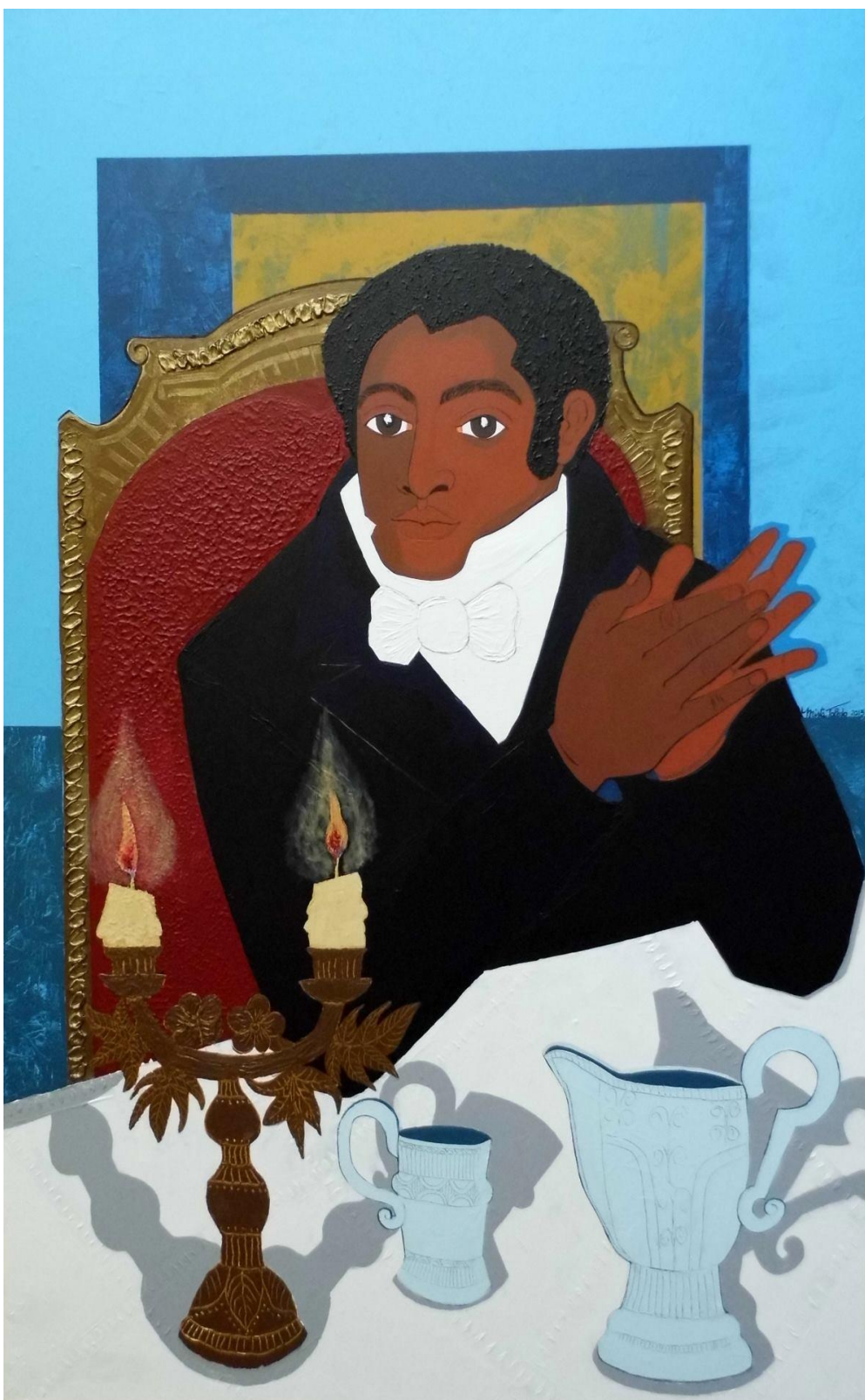
Figura 14. «Retrato de Bernardino Rivadavia (Primer Presidente Argentino)», Mirta Toledo.