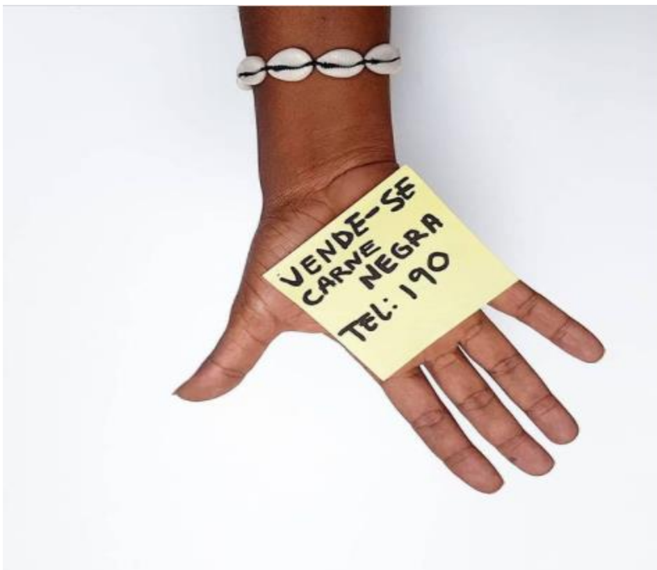
Figura 5. Fotografía de la serie «Aceita?», Moisés Patricio. Fuente: https://www.instagram.com/moisespatricio/ , 6 de diciembre de 2019.