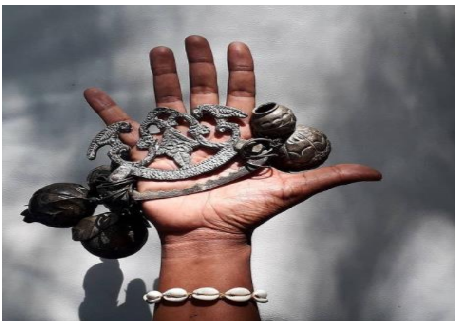
Figura 6. Fotografía de la serie «Aceita?», Moisés Patricio. Fuente: https://www.instagram.com/moisespatricio/ , 6 de diciembre de 2019.