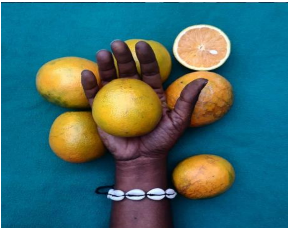
Figura 9. Fotografía de la serie «Aceita?», Moisés Patrício.

Fuente: https://www.instagram.com/moisespatricio/ , 26 de junio de 2020.