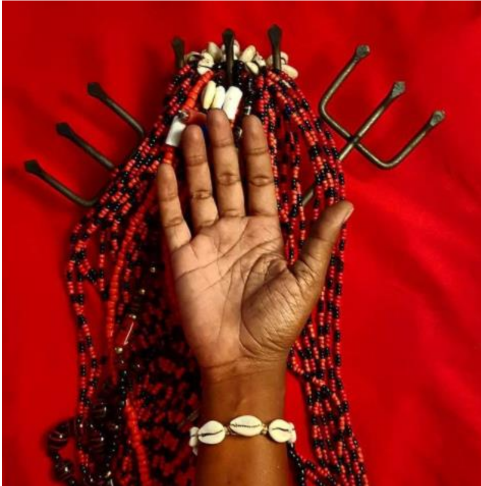
Figura 4. Fotografía de la serie «Aceita?», Moisés Patricio.