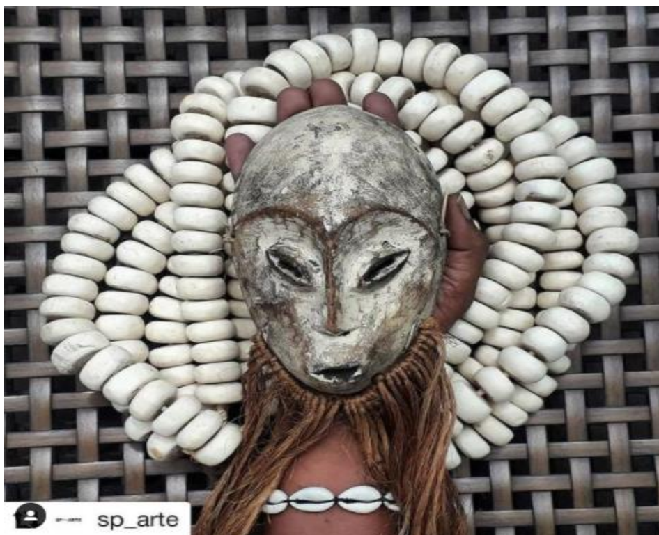
Figura 1. Fotografía de la serie «Aceita?», Moisés Patrício.