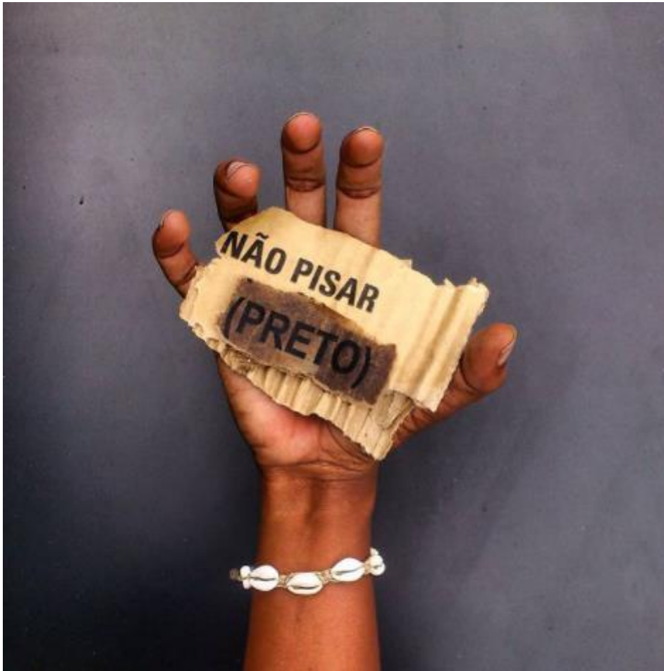
Figura 8. Fotografía de la serie «Aceita?», Moisés Patrício.