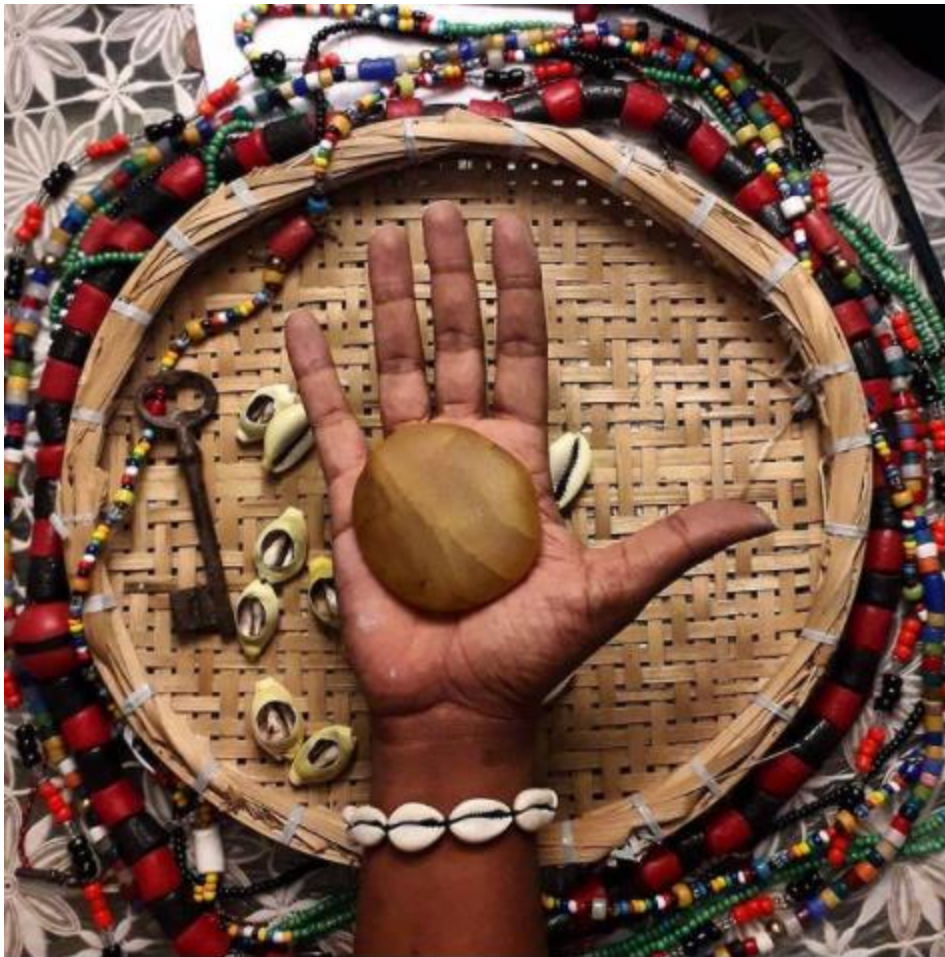
Figura 3. Fotografía de la serie «Aceita?», Moisés Patrício.

Las fotografías que componen este conjunto se basan en referencias religiosas a la práctica del candomblé. Así, aparecen las deidades, llamadas orixás, especialmente Exu, que es la divinidad que guía al artista desde su nacimiento. Además, en este grupo hay elementos de las prácticas religiosas y rituales realizados en el marco del candomblé, como collares y caracoles, del mismo modo que otros personajes u objetos relacionados con la cultura popular afro en Brasil, como Seu Zé Pilintra, personaje de la cultura umbanda y la «mano figa» o «mano poderosa», que significa buena suerte y aleja el mal. Estas imágenes implican, entonces, una muestra de la espiritualidad afro y popular.