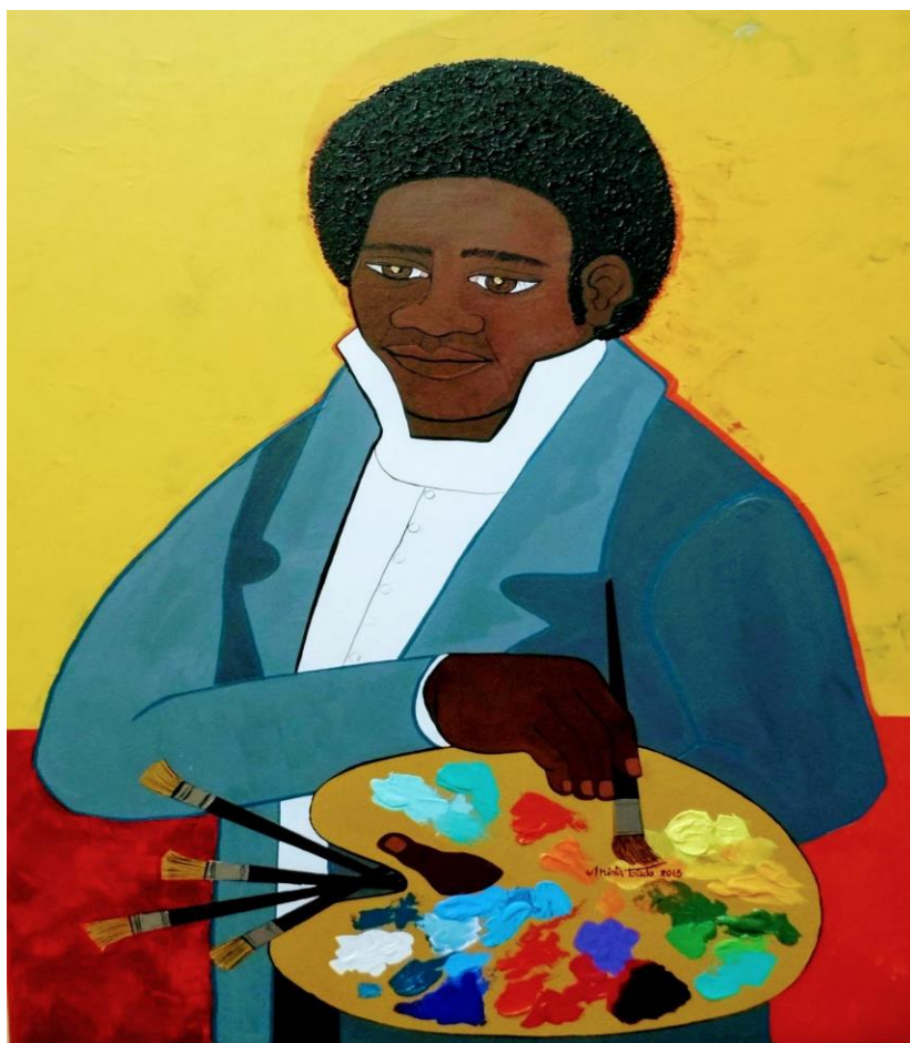
Figura 15. «Retrato de Fermín Gayoso, el primer pintor porteño», Mirta Toledo.

Fermín Gayoso (ca. 1790 – fecha desconocida), pintor y esclavizado de la familia de Juan Martín de Pueyrredón, es otra de las personas retratadas por Toledo. Gayoso fue, a pesar de su condición de esclavizado, un pintor que llegó hasta España para solicitar su libertad luego de su participación en las batallas contra las invasiones inglesas en Argentina entre 1806 y 1807. Quiso ingresar a la Escuela de Dibujo del Consulado, pero le fue impedido por su condición de mestizo. Fue el primer maestro de Prilidiano Pueyrredón (Castillo, 2013).